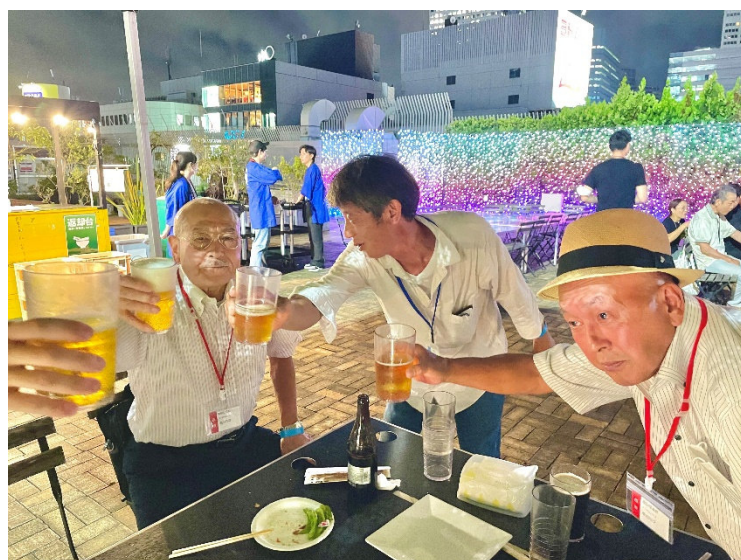
分会の仲間と 5 年ぶりの再会

これからも各事業所さんに訪問し、電話かけしますので新たに入社される方や、お仕事の仲間がいらっしゃいましたら、是非渋谷支部に紹介してください。仲間の皆さんが頼りです。よろしくお願いします。