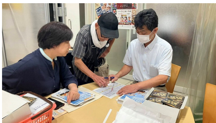
日曜行動前の作戦会議