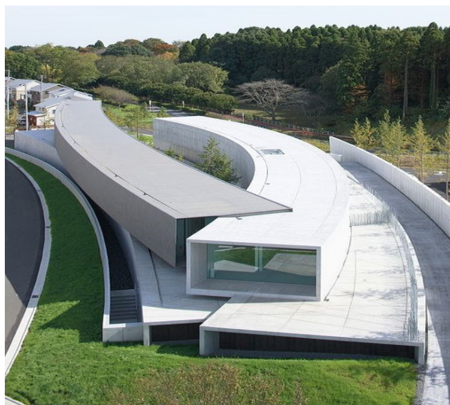
ホキ美術館 写実絵画専門美術館 2010年開館 建築設計 日建設計 1階のギャラリーは30mが宙に浮いた構造 (千葉市緑区)