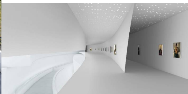
回廊型ギャラリー